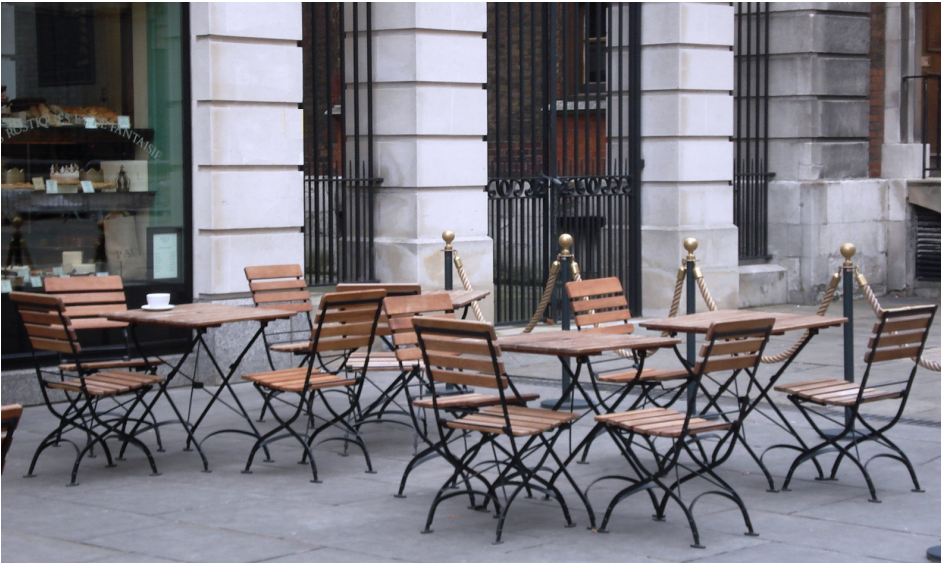
Stellbeispiel bestehend aus: Tisch SENJA 88 und Stuhl SENJA

Der Tisch SENJA überzeugt durch maximale Funktionalität und Robustheit, er lässt sich einfach zusammenklappen und praktisch aufbewahren.