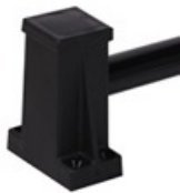
Kunststoff-Puffer für sicheres Stapeln der Tische