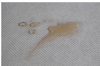
Flüssigkeiten perlen auf diesem Stoff ab.

Wenn Sie sich für unsere Sitzmöbel mit diesem Bezug entscheiden, so ist dies mit Aufpreis möglich. Der oben angegebene Preis gilt für den Kauf von Meterware, wenn Sie mit diesem Stoff Ihre bereits vorhandenen Möbel beziehen möchten.