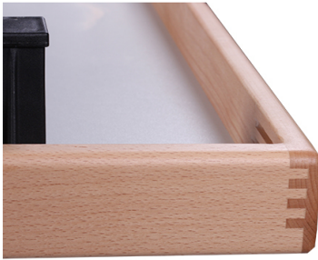
Aufkantung aus Massivholz Buche mit Fingerverzinkung