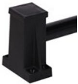
Kunststoff-Puffer für sicheres Stapeln der Tische