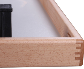
Aufkantung aus Massivholz Buche mit Fingerverzinkung