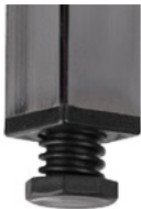
4 x robuste Bodenausgleichsschrauben